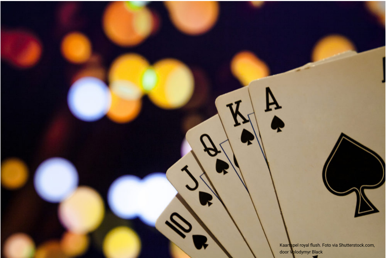
Kaartspel royal flush.

Door Wout Willemsen (https://www.dagelijksestandaard.nl/author/wout-willemsen/), 12 januari 2021